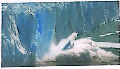
1 I GHIACCIAI SI SCIOLGONO E...