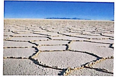
3 SI DEPOSITANO SUL FONDO MARINO CHE EVAPORA FORMANDO I DESERTI SALATI