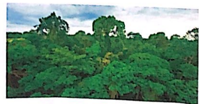
5 FORESTE NEL MONDO CHE PRODUCONO OSSIGENO