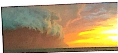
4 LE TEMPESTE DI SABBIA TRASPORTANO I NUTRIMENTI DAI DESERTI SABBIOSI ALLE...